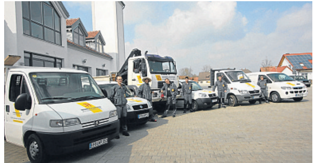
Die Fahrzeugflotte der Bauunternehmung Wimmer & Partner.

WIR GRATULIEREN ZUM JUBILÄUM UND DANKEN FÜR DIE GUTE ZUSAMMENARBEIT!